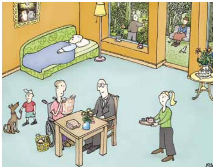
Maar zo! (afbeeldingen uit IDé's promotiemateriaal)

Augustus 2011 introduceerde IDé het Waarborgzegel Fixatievrije Zorginstelling . Met dit keurmerk kunnen zorginstellingen zich onderscheiden en laten zien hoe ver ze zijn met het terugdringen van vrijheidsbeperking. De criteria worden elke twee jaar herijkt aan de laatste inzichten. Eind 2012 waren er 80 zorginstellingen met één of meer sterren van het waarborgzegel.