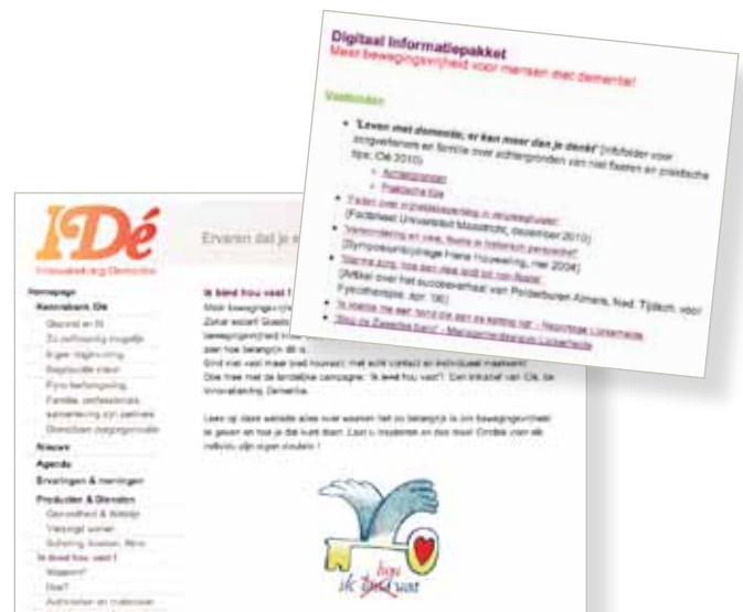
Rubriek m.b.t. terugdringing vrijheidsbeperking op de website van IDé