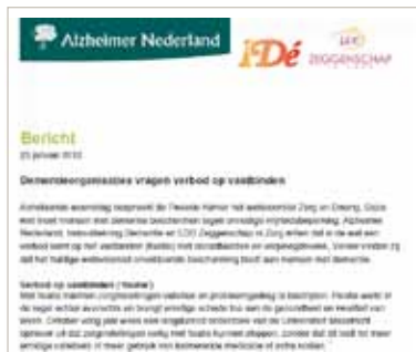
Gezamenlijk persbericht van IDé, Alzheimer NL en LOC Zeggenschap in Zorg

Anderen sluiten zich aan bij IDé's standpunten. Januari 2012 pleiten IDé, Alzheimer NL en LOC Zeggenschap in Zorg in een gezamenlijk persbericht voor een verbod op vastbinden en voor minder gebruik van antipsychotica en andere versuffende medicatie.