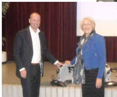
Campagne 'Elektrische trapfietsjes'