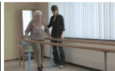
Beelden uit de IDé film